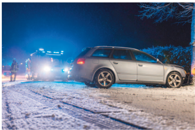
Der Rettungsdienst versorgte die drei Personen