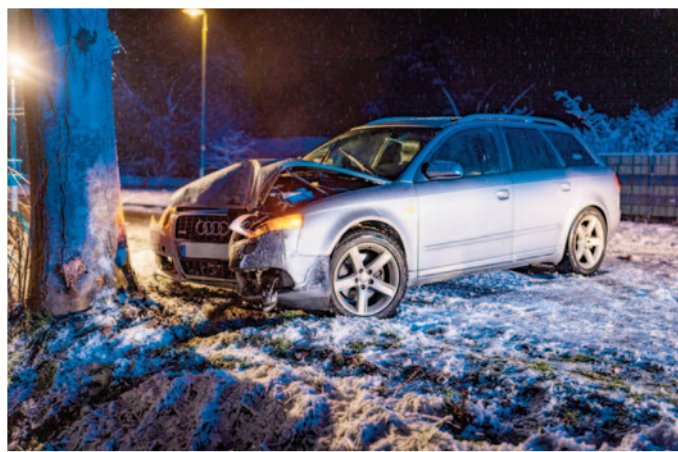
Ein PKW prallte gegen einen Baum in Bavendorf