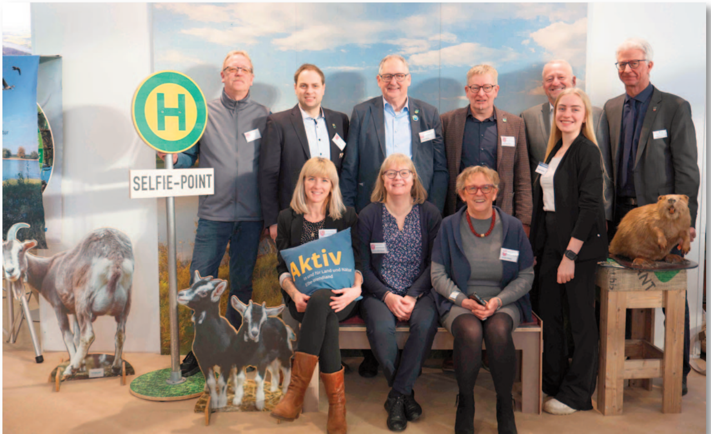
Team Ostheide und Elbtalaue