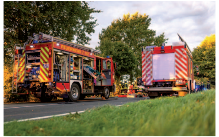
Feuerwehr Ostheide im Einsatz