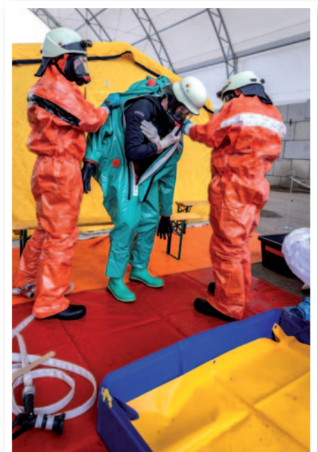
Auskleiden nach Dekontamination

Nach getaner Arbeit dekontaminierte man auch die Einsatzkräfte. Hierbei ist mit Sorgfalt zu arbeiten, um die Kontamination nicht zu verschleppen. Eine Kraft arbeitet von außen (schwarze Markierung), eine