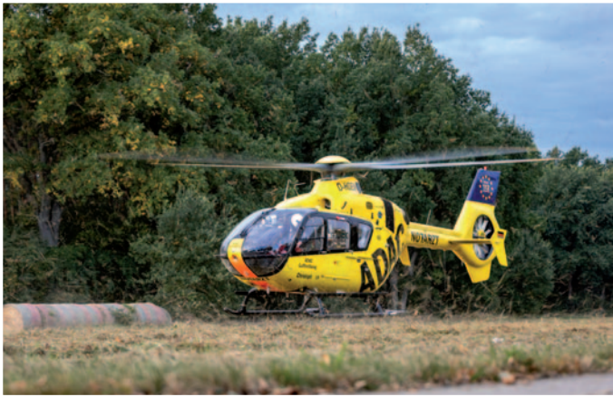
Christoph 19 vor Ort

Aufgrund der Aufnahme der Unfallstelle wurden lediglich Betriebsstoffe mittels Bindemittel aufgenommen, aber die Unfallstelle nicht geräumt. Die Unfallstelle wurde an die Polizei übergeben. Insgesamt 37 Einsatzkräfte der Feuerwehr Ostheide waren im Einsatz.