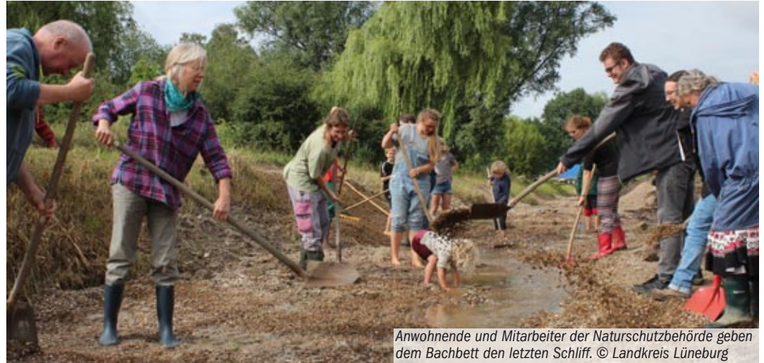
Anwohner und Mitarbeiter der Naturschutzbehörde geben dem Bachbett den letzten Schliff.