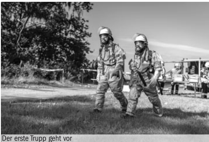
Der erste Trupp geht vor