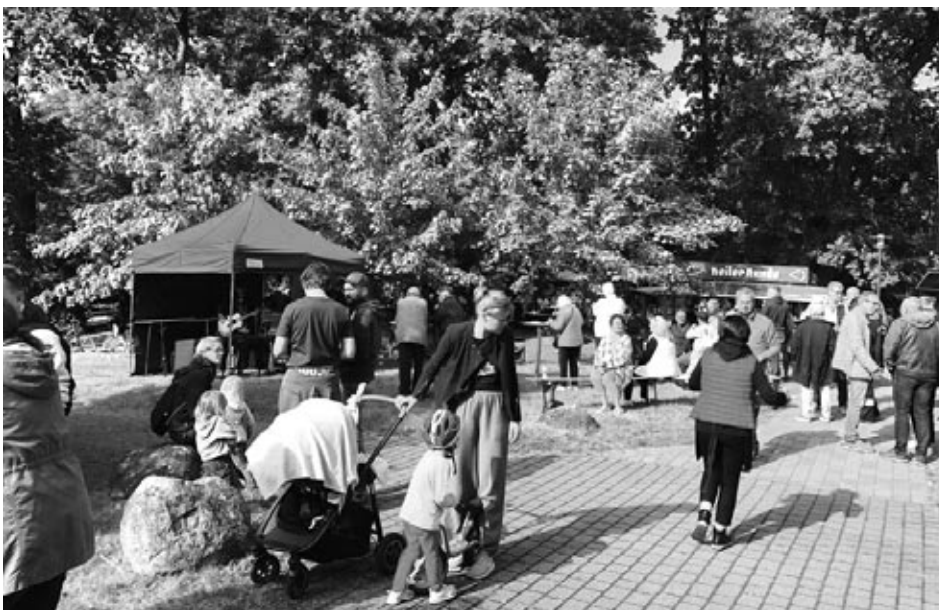
Buntes Treiben unter den Eichen