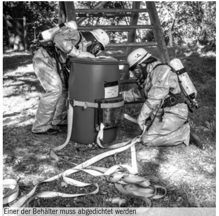
Einer der Behälter muss abgedichtet werden