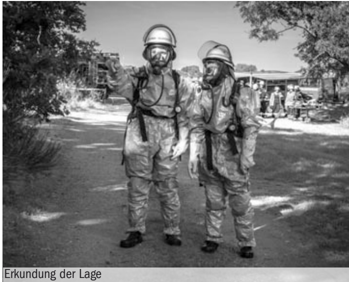
Erkundung der Lage