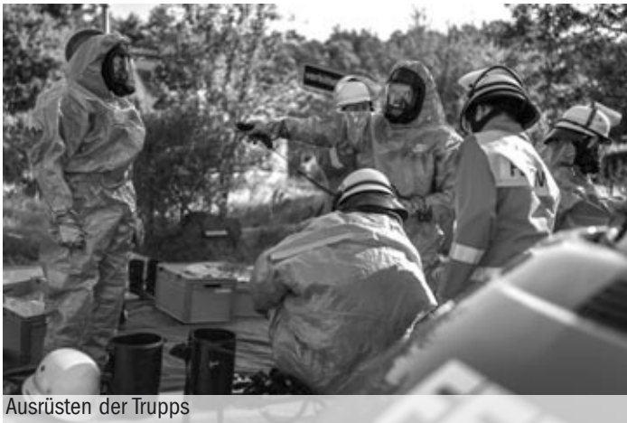
Ausrüsten der Trupps