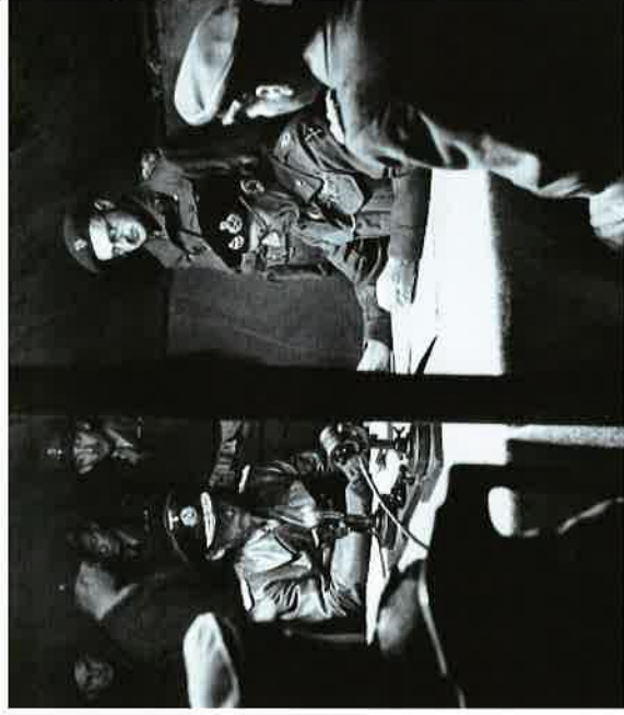
Montgomery unterzeichnet die Kapitulationsurkunde am 4. Mai 1945 im Zelt auf dem Timeloberg.

Auf dem Timeloberg bei Wendisch Evern wurde am 4. Mai 1945 das Ende des Zweiten Weltkrieges in Europa und damit die Befreiung von der national-sozialistischen Gewaltherrschaft eingeleitet. Hier unterzeichnete eine Delegation des Oberkommandos der Wehrmacht die bedingungslose Kapitulation aller deutschen Truppen in Holland, Nordwestdeutschland, Schleswig-Holstein und Dänemark gegenüber der britischen Armeeführung unter Feldmarschall Bernard L. Montgomery. Die Waffenruhe in diesen Gebieten trat am 5. Mai um 8.00 Uhr in Kraft. In den Niederlanden und in Dänemark ist dieser Tag bis heute Gedenk- bzw. Nationalfeiertag. In Deutschland ist dieser Vorgang weitgehend unbekannt geblieben.