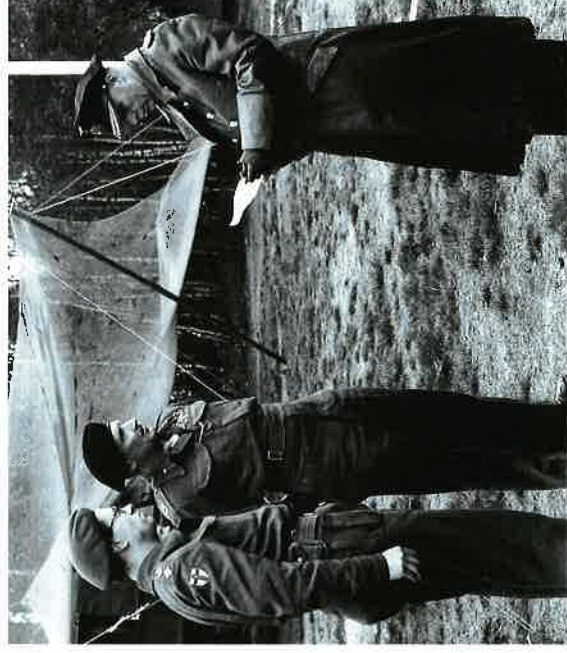
Feldmarschall Montgomery (Mitte) im Gespräch mit Generaladmiral von Friedeburg. Links der englische Dolmetscher.

Für den formellen Akt der Teilkapitulation wurde bewusst der Timeloberg ausgewählt. Von dieser höchsten Erhebung im Umkreis von Lüneburg blickte man herab auf die Türme einer deutschen Stadt, die sich gerade kampfflos ergeben hatte. Feldmarschall Montgomery nannte den Hügel deshalb „Victory Hill“. Mit der Kapitulation setzte er durch, dass die deutsche Armeeführung die vollständige Niederlage der deutschen Truppen im Norden anerkannte und besiegelte.