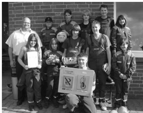
Gesamtsieger und Sieger beim Spiel ohne Grenzen: Gruppe Neetze