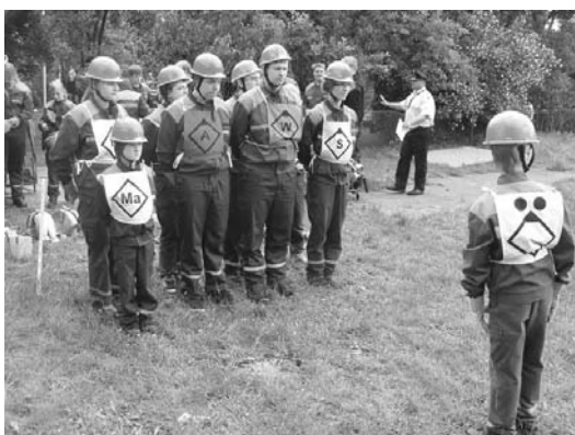
JF-Gruppe Barendorf beim Bundeswettbewerb

Bei den Kinderfeuerwehren gewann die Gruppe Neetze II vor der Gruppe aus Wendisch Evern und Barendorf II.