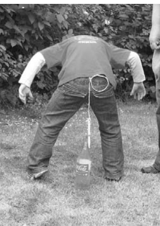
Geschicklichkeitsspiel beim Spiel ohne Grenzen

Am Samstag fand der erste gemeinsame Gemeindegemeindekinder- und Jugendfeuerwehrtag der Samtgemeinde Ostheide statt.