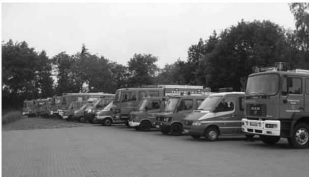
Die Fahrzeuge der SG Feuerwehr

Mit reichlich Wasser von oben, feierten die elf Feuerwehren der Samtgemeinde Ostheide am Samstag ihren Feuerwehrtag in Barendorf.